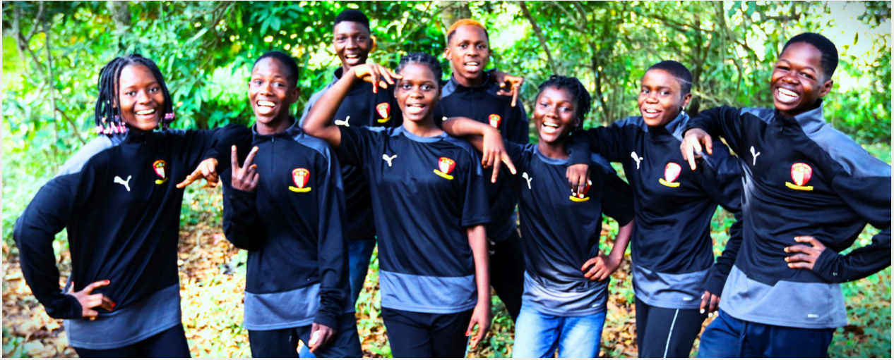
AKHIN participants at Nigeria cultural night