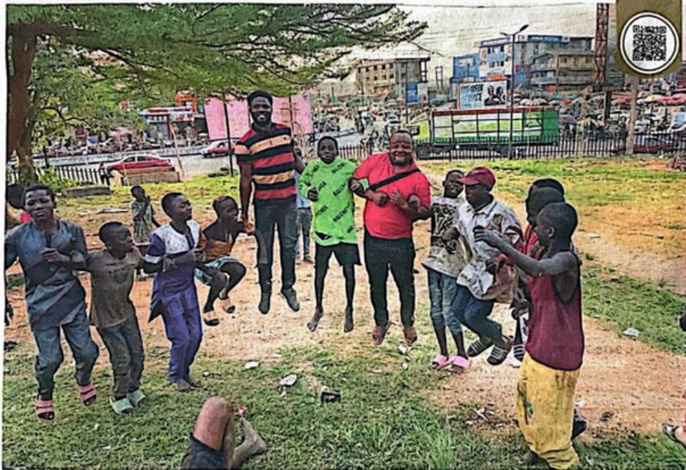
Op donderdag 20 juni vindt in The B een benefietevent voor straatkinderen in Nigeria plaats.